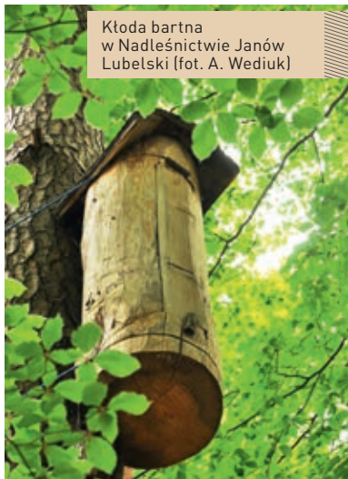
Kłoda bartna w Nadleśnictwie Janów Lubelski

O powrocie do tradycji w lubelskich lasach