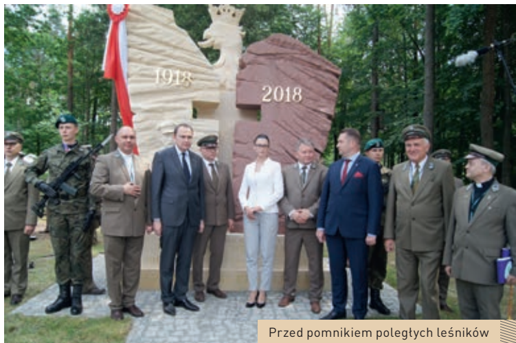
Przed pomnikiem poległych leśników