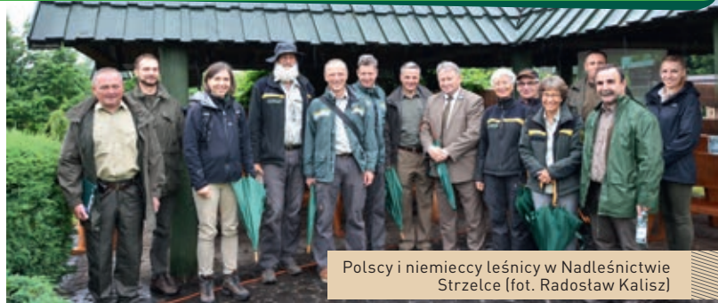
Polscy i niemieccy leśnicy w Nadleśnictwie Strzelce

Polscy i niemieccy leśnicy wykonują na co dzień podobne obowiązki, choć gospodarka leśna w obu krajach opiera się na zupełnie innych zasadach. Kolejna partnerska wizyta w lasach Lubelszczyzny była znakomitą okazją do wymiany doświadczeń i prezentacji rodzimego modelu leśnictwa, który w opinii wielu przedstawicieli braci leśnej może służyć innym państwom europejskim jako wzór do naśladowania. Pracownicy Nadleśnictwa Chełm starali się zobrazować specyfikę pracy w oparciu o zapisy planu urządzenia lasu. Podjęcie tego tematu sprowokowało liczne pytania ze strony leśników z Badenii-Wirtember-